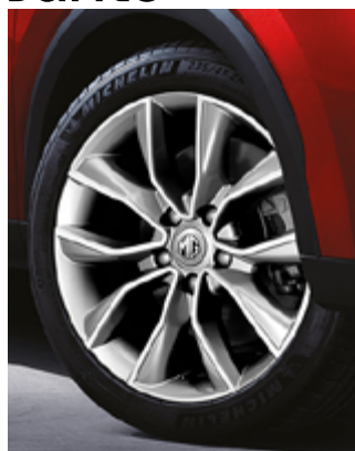
Jante aliaj 17"