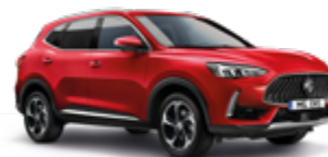
Diamond Red (metallic)