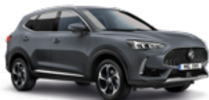
Magic Grey (metallic)