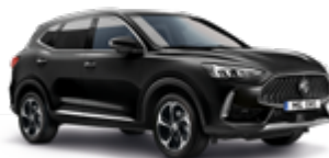
Pebble Black (metallic)