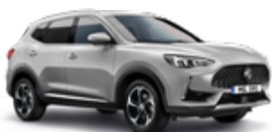
Medal Silver (metallic)