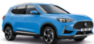
Brighton Blue (metallic)