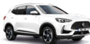
Dover White (non-metallic)