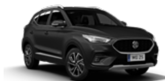
Pebble Black (metallic)