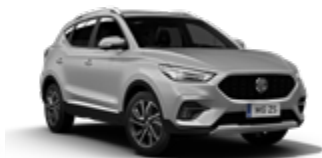
Monument Silver (metallic)