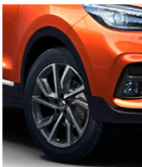
Jante 17" model Active (motorizare 1.0)