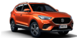
Hexton Orange (metallic)