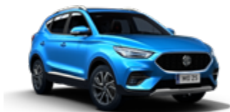
Cosmo Blue (metallic)