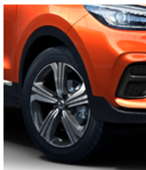
Jante 17" model Dinamic (motorizare 1.5)