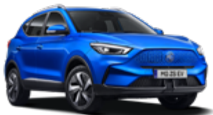
Cosmo Blue (metallic)