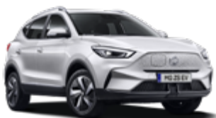
Dover White (non-metallic)