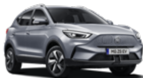
Monument Silver (metallic)