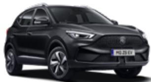
Pebble Black (metallic)