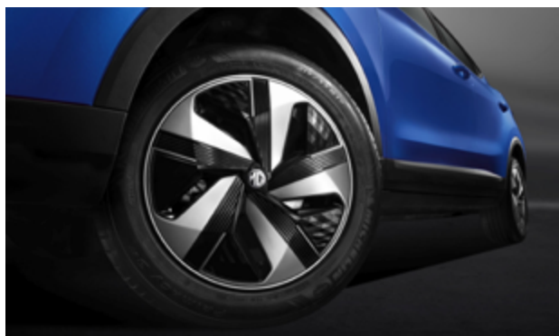
Jante din oțel de 17" + capac Aero