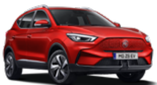
Diamond Red (metallic)